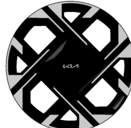
18-calowe felgi aluminiowe, wersja L oraz Business Line