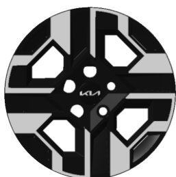
16-calowe felgi aluminiowe, wersja M